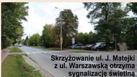
Skrzyżowanie ul. J. Matejki z ul. Warszawską otrzyma sygnalizację świetlną