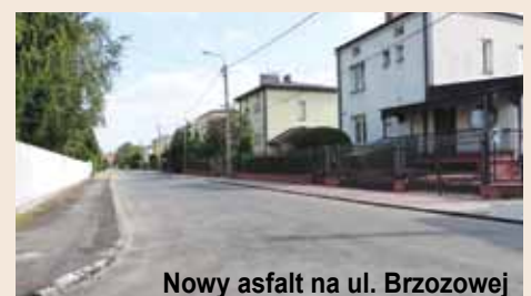
Nowy asfalt na ul. Brzozowej