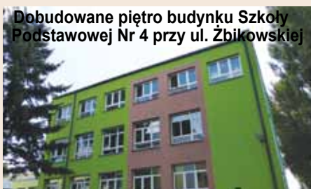
Dobudowane piętro budynku Szkoły Podstawowej Nr 4 przy ul. Żbikowskiej