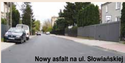
Nowy asfalt na ul. Słowiańskiej