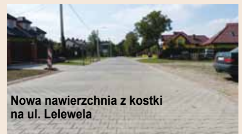
Nowa nawierzchnia z kostki na ul. Lelewela