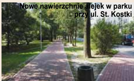
Nowe nawierzchnie alejek w parku przy ul. St. Kostki