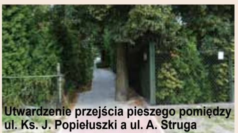
Utwardzenie przejścia pieszego pomiędzy ul. Ks. J. Popiełuszki a ul. A. Struga