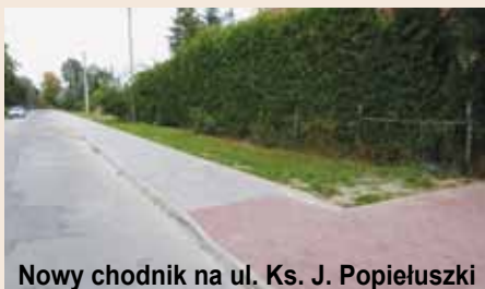
Nowy chodnik na ul. Ks. J. Popiełuszki