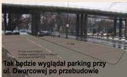
Tak będzie wyglądał parking przy ul. Dworcowej po przebudowie