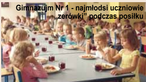
Gimnazjum Nr 1 - najmłodsi uczniowie „zerówki” podczas posiłku