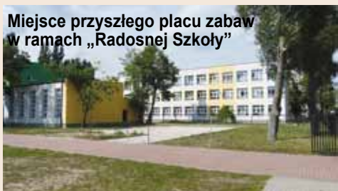
Miejsce przyszłego placu zabaw w ramach „Radosnej Szkoły”