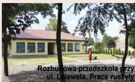
Rozbudowa przedszkola przy ul. Lelewela. Prace ruszyły

- Czy pod względem modernizacji piastowskiej infrastruktury rok 2012 zaliczy Pan do udanych? - pytamy burmistrza Piastowa, Marka Kubickiego.