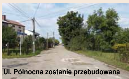
Ul. Północna zostanie przebudowana