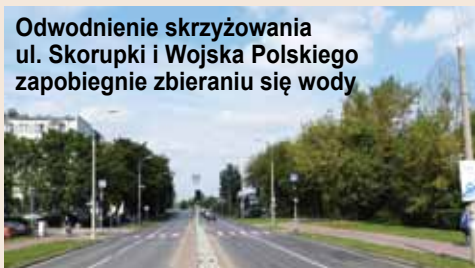
Odwodnienie skrzyżowania ul. Skorupki i Wojska Polskiego zapobiegnie zbieraniu się wody