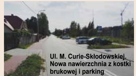
Ul. M. Curie-Skłodowskiej. Nowa nawierzchnia z kostki brukowej i parking

Zrealizowano nową nawierzchnię ul. M. Skłodowskiej-Curie wraz z budową parkingów na odcinku od ul. Bohaterów Wolności do ul. H. Wieniawskiego – koszt: 533.032 zł. Dodatkowo, w ramach kontynuacji przebudowy tej ulicy, zmodernizowano miejsca postojowe na terenie Przedszkola Miejskiego nr 1 przy ul. S. Moniuszki wraz z wykonaniem furtki i bramy wjazdowej na teren przedszkola od ul. M. Skłodowskiej-Curie. Pozwala to na bezpieczne przywożenie i odbieranie dzieci z i do przedszkola oraz zapobiega tworzeniu się zatorów ulicznych na ul. S. Moniuszki