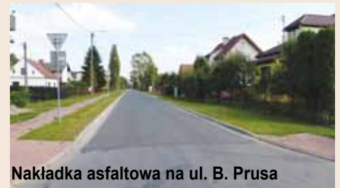
Nakładka asfaltowa na ul. B. Prusa