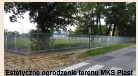
Estetyczne ogrodzenie terenu MKS Piast