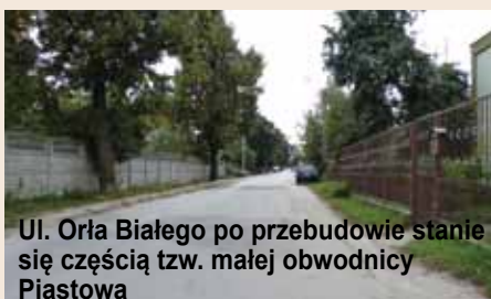
Ul. Orła Białego po przebudowie stanie się częścią tzw. małej obwodnicy Piastowa