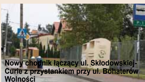
Nowy chodnik łączący ul. Skłodowskiej-Curie z przystankiem przy ul. Bohaterów Wolności

została wykonana z płyt chodnikowych znajdujących się w stanie magazynowym Urzędu Miejskiego w Piastowie. Ułożono połączenie chodnikowe przebudowanej ul. M. Skłodowskiej-Curie z pobliskim przystankiem autobusowym na ul. Bohaterów Wolności. Dzięki temu mieszkańcy Piastowa otrzymali bezpieczną drogę do najbliższego środka komunikacji. Wykonano odcinek nowego chodnika wzdłuż ul. Bohaterów Wolności na odcinku od ul. St. Moniuszki do ul. M. Skłodowskiej-Curie.