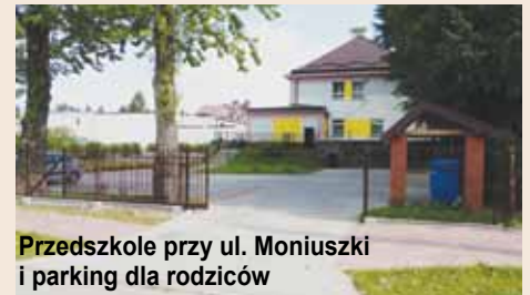
Przedszkole przy ul. Moniuszki i parking dla rodziców