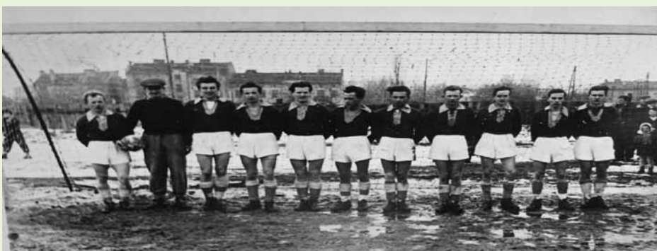
Piłkarze piastowskiego klubu w sezonie 1948/49