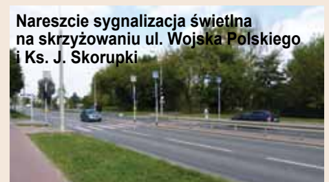
Nareszcie sygnalizacja świetlna na skrzyżowaniu ul. Wojska Polskiego i Ks. J. Skorupki