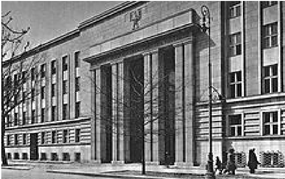
Al. Szucha 25 w Warszawie. w czasie okupacji siedziba warszawskiego Gestapo