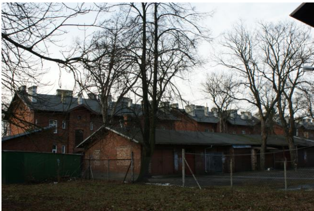
Widok wnętrza kwartału od strony pd.-wsch. z budynkiem gospodarczym