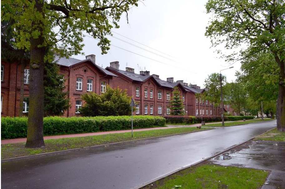
Widok ogólny zespołu od strony ul. Harcerskiej

8. Fotografia z opisem wskazującym orientację albo mapa z zaznaczonym stanowiskiem archeologicznym