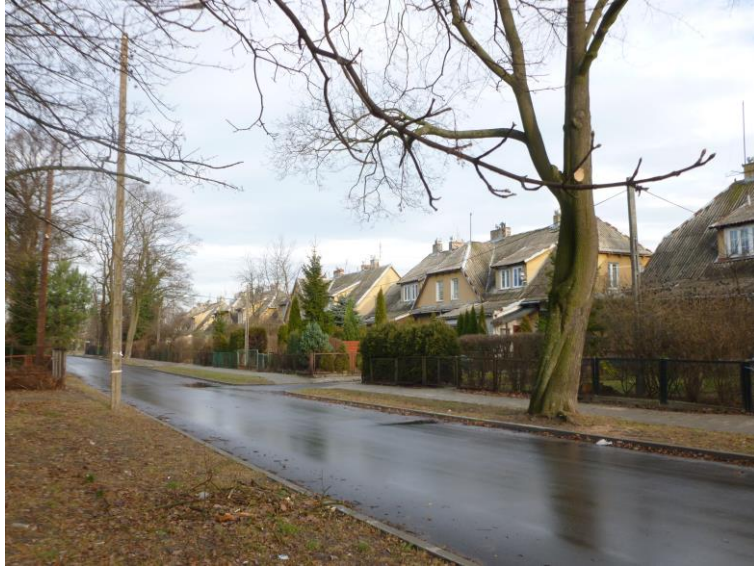
Widok ogólny zespołu od strony ul. ks. J. Popiełuszki

8. Fotografia z opisem wskazującym orientację albo mapa z zaznaczonym stanowiskiem archeologicznym