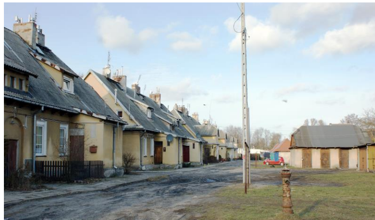
Widok ogólny zespołu od strony podwórza