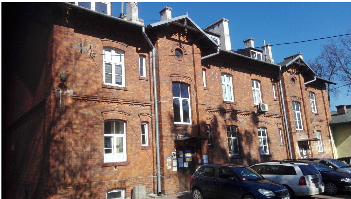
Zabytkowy budynek mieszkalny wielorodzinny, obecnie biurowy, ul. 11 Listopada 8.