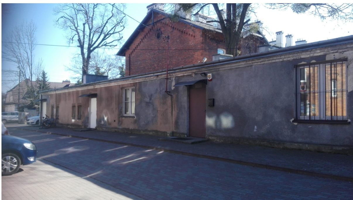
Zabytkowy budynek gospodarczy, przebudowany, ul. 11 Listopada 8.