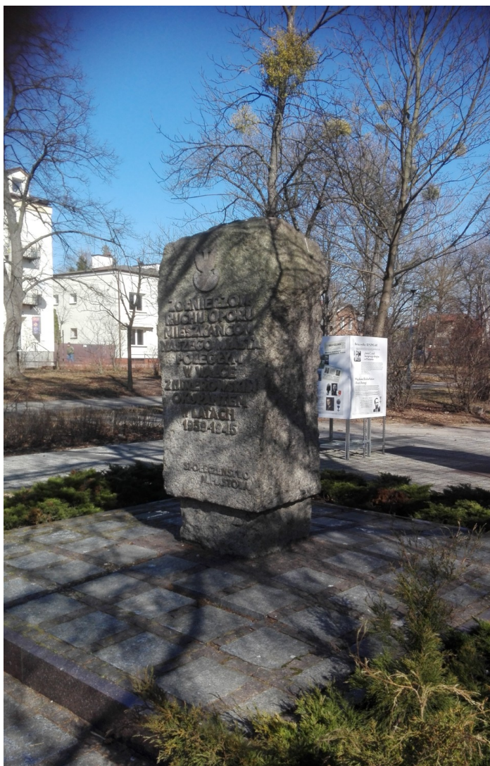
Pomnik poświęcony żołnierzom ruchu oporu z terenu Piastowa, w parku miejskim.